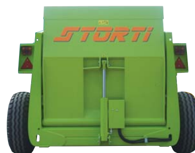
Parte posteriore della macchina