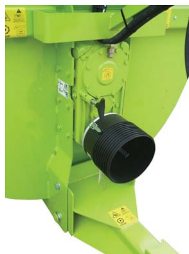
Cambio a due velocità (270 e 540 giri/min)